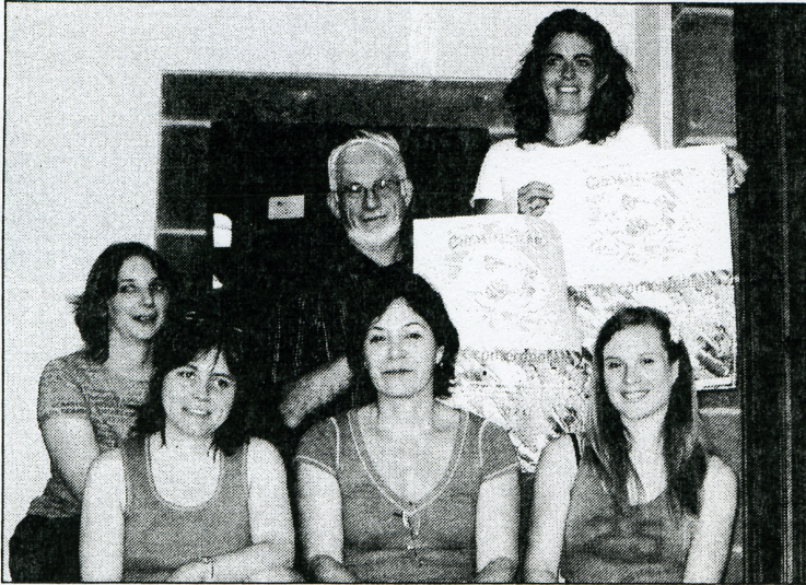
Une partie des artistes de Chemin d'Art 2006, une manifestation placée sous la responsabilité matérielle financière et juridique de la ville et soutenue par la DRAC, le FRAC, le Conseil général, le Parc régional des volcans d'Auvergne.

Chemin d'art fête cette année sa 13 ème édition. Invités, 8 artistes contemporains exposent en ville leurs créations du 8 juillet au 20 août. Tous sont à l'oeuvre et le public pourra les découvrir avec leur création lors du vernissage, samedi. Avant goût.